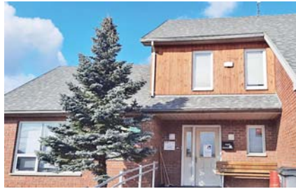
Chráněné bydlení – Stříbrný dům.

Na území města Dvůr Králové nad Labem se nacházejí dva rodinné domky, v nichž je poskytována pobytová sociální služba Chráněné bydlení. Klientům poskytují podporu pracovníci v sociálních službách, a to v rozsahu jejich individuálních potřeb. Klienti jsou vedeni k vlastní zodpovědnosti a samostatnosti. Prostřednictvím nácviků si upevňují dovednosti týkající se běžných činností jako péče o vlastní osobu, péče o domácnost, hospodaření s peněží, činnosti související s volnočasovými zájmy aj. V místě svého bydliště rovněž klienti využívají běžně dostupné služby – restaurace, kadeřník, pedikúra, obchody apod.